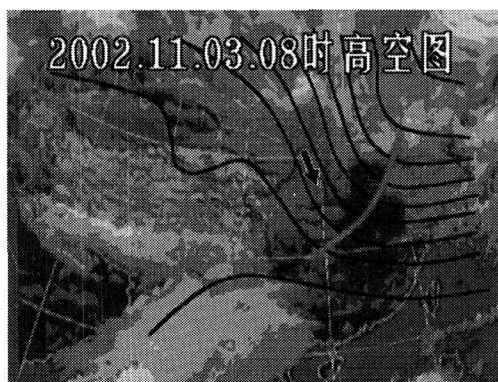
图 3 河南卫视 2002 年 11 月 3 日使用的天气预报形势图

利用该软件制作了河南卫视频道 2002 年 11 月 5 日使用的高空图与云图的叠加图,运行后生成的屏幕图形见图 3。