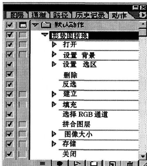
图 1 动作控制菜单

现在,就可以按 3.3 所述的操作步骤处理在 2.3 中生成的 BMP 格式的图片了,所有操作过程及参数设置会逐一记录在动作命令清单中(见图 1)。